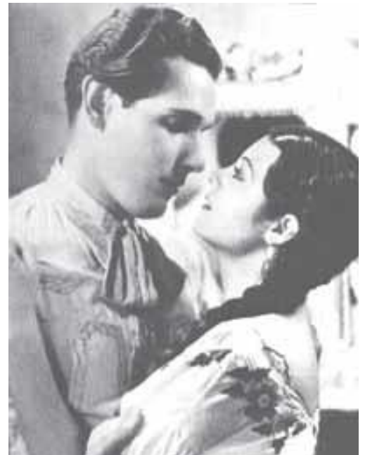
Tito Guízar y Esther Fernández, protagonistas de Allá en el Rancho Grande (Fernando de Fuentes, 1936)

En 1936 se produjo Allá en el Rancho Grande de Fernando de Fuentes, que logró alternar los diálogos con las canciones. El encargado de esta cinta fue Gabriel Figueroa, quien ganó el Galardón en fotografía en el Festival de Venecia del mismo año, contribuyendo de esta forma al cine mexicano en el extranjero. Las comedias rancheras ocuparon el 50% del total de la producción México.