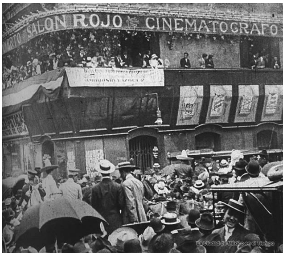
Salón rojo.

Emilio García Riera, en su libro Breve historia del cine mexicano (1897-1997), explica que México fue uno de los primeros países que conoció el cinematógrafo, luego de que el 28 de diciembre de 1895, el Cinématographe Lumère iniciara sus exhibiciones en el Grand Café (Boulevard des Capucines), en Francia.