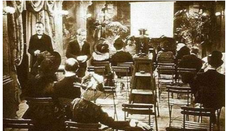
Primera proyección en México.