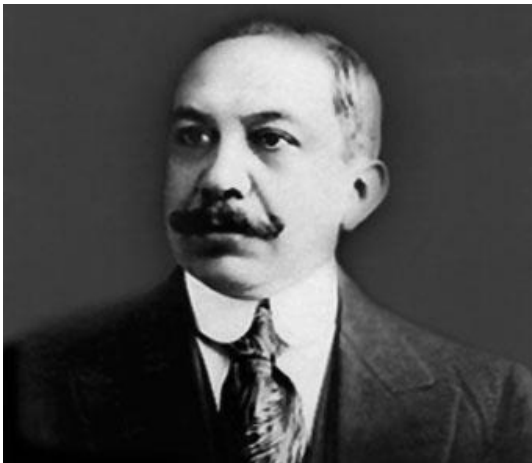
Salvador Toscano.

En 1908 se estableció el primer taller o estudio cinematógrafo llamado The American Amusement, Lilo, García y Compañía . La primera película mexicana original con guion se llamó: El Grito de Dolores en la cual se representaban los momentos más importantes de la Independencia. Esta cinta corrió a cargo de la dirección de Felipe de Jesús Haro, quien también fue protagonista.