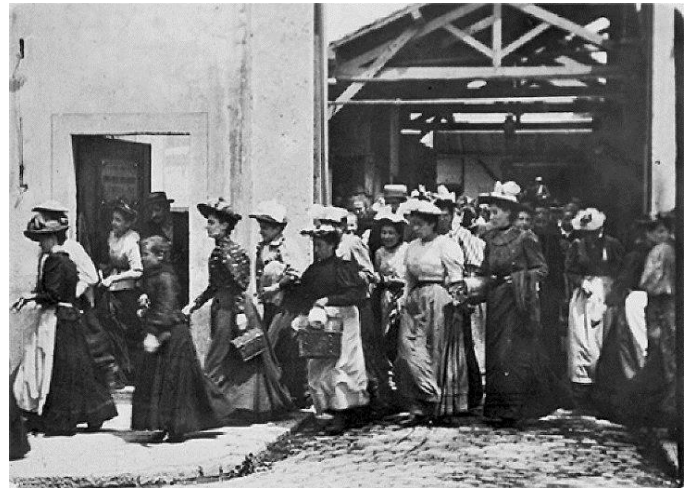
Un fotograma de La Salida de la fábrica Lumière en Lyon.

Los primeros filmes captados por el cinematógrafo de los Lumière consistían en representar escenas de la vida diaria, ya que no se contaba con una narrativa en cuanto al desarrollo de una historia se refiere, siendo “ La salida de los trabajadores de la fábrica de los hermanos Lumiere ” la primer cinta comercial proyectada al público.