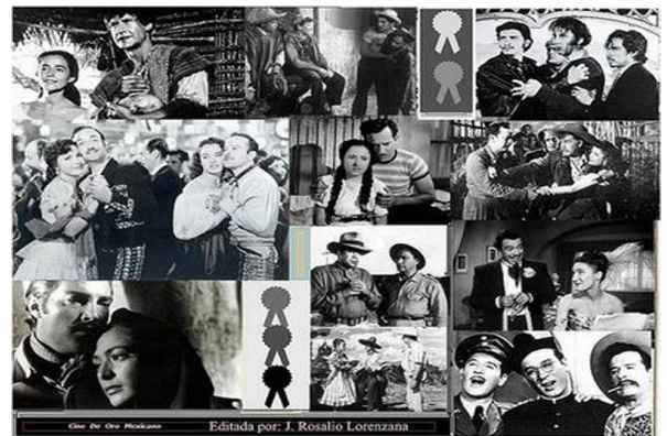
La época de oro del cine mexicano

En esta época de auge surgieron nuevos géneros de cine, como el ranchero, cabaret y los temas fatalistas. En el caso del ranchero, sus exponentes más reconocidos internacionalmente fueron: Jorge Negrete , María Félix , Cantinflas , Dolores de Río , Sara García , Joaquín Pardavé , Pedro Infante , Pedro Armendáriz , Luis Aguilar , Rosita Quintana , Flor Silvestre , Silvia Pinal , Tin Tan , entre otros.