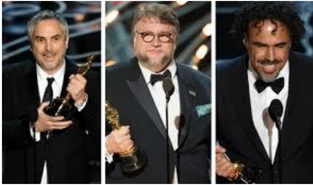
Cuarón, Del Toro y González Iñárritu.

En 1995 el cine en México se vio afectado por la crisis económica, para buscar una salida, el Ejecutivo Federal creó FOPROCINE (Fondo para la Producción Cinematográfica de Calidad), que tuvo por objeto apoyar óperas primas y un cine más autoral y experimental. Este Fondo impulsó el incremento de producción de muchas películas, entre sus primeras fueron dos largometrajes: Sexo, Pudor y Lágrimas de Antonio Serrano y El crimen del padre Amaro de Carlos Carrera.