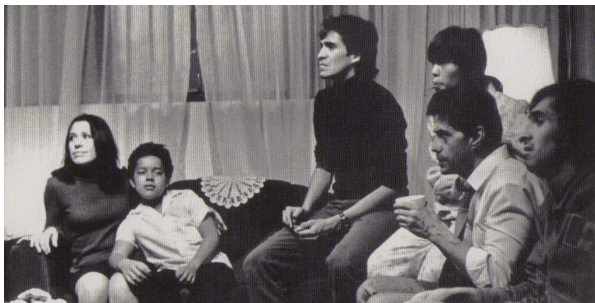
Rojo amanecer (1989). Director Jorge Fons

En esta nueva etapa del cine, aparecen directores con nuevas ideas y aportaciones al cine: Arturo Ripstein, María Novaro, Alfonso Arau y Carlos Carrera; por mencionar algunos de la década de los 90s. Además, se une un nuevo elenco actoral donde encontramos a: Patricia Reyes Espíndola, los hermanos Bichir y María Rojo, por mencionar algunos.