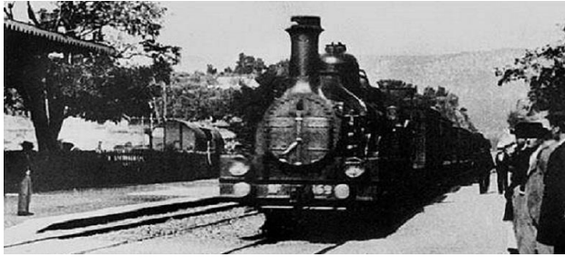
Fragmento de la llegada del Tren

Entre las primeras crónicas de la época, destaca la del escritor mexicano Luis G. Urbina, quien comentó sobre La llegada del tren lo siguiente: “La escena es tan natural que hasta parece percibirse el ruido del tren y el murmullo de los pasajeros” .