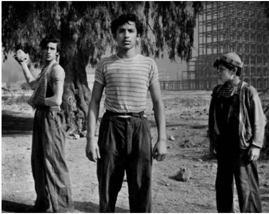
Los olvidados (1950) de Luis Buñuel, película ganadora del Premio a mejor Director en el Festival de Cannes

Dentro de la reconocida trayectoria del director Emilio Fernández destacan las siguientes cintas: Soy Puro Mexicano (1942), María Candelaria (1943), La perla (1945), Maclovía (1948), Pueblerina (1949), Victimas del Pecado (1950) y Una cita de amor (1958).