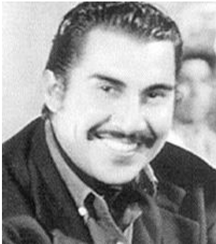
Emilio El Indio Fernández.

La segunda Guerra Mundial coincide con el cine sonoro mexicano que estaba en su mejor momento, mientras que Estados Unidos se ve imposibilitado de producir cintas debido a su crisis económica y al periodo de posguerra que atravesaba.